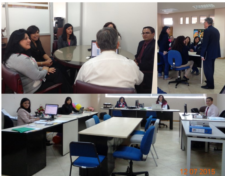
Instalación de la Entidad Operativa Desconcentrada (EOD)