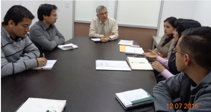
Instalación de la Comisión de Acreditación de Laboratorios (CAL)

Por la necesidad imperiosa de que los laboratorios de la EPN, y en especial los laboratorios de investigación y de servicios se acrediten con la Norma ISO 17025, se ha creado, en el seno del Consejo de Investigación y Proyección Social (CIPS), en su sesión ordinaria del día 4/07/2016, la Comisión de Acreditación de los Laboratorios de la EPN (CAL) , la cual tendrá como principal función gestionar y coordinar la implementación del Sistema de Gestión de Calidad y la acreditación de los laboratorios de la EPN. Esta acreditación permitirá el acceso a fuentes de autofinanciamiento que hasta el momento han sido poco explotadas pero que cuentan con un potencial enorme de vinculación con la industria.