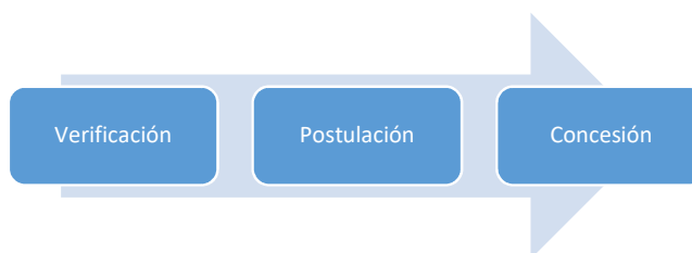
Figura 2. Etapas

En la Fig. 2 se presentan las diferentes etapas del procedimiento para la beca al mérito cultural.